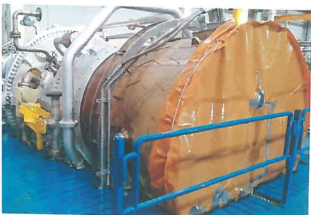
Первая из восьми турбин для новых станций в Калининградской области

Газотурбинные установки будут укомплектованы генераторами ТФ-90Г-2У3 производства НПО «ЭЛСИБ» и другим вспомогательным оборудованием российских поставщиков.